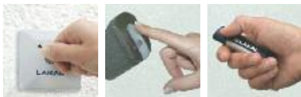
Schlüsselschalter, Biometrik-Sensor, Funkhandsender

Für alle LAKAL-Tore gilt gleichermaßen: Das Öffnen und Schließen Ihres Tores erfolgt automatisch – entweder über einen Schüsselschalter, einen komfortablen 2-Kanal-Funkhandsender oder per Biometrik-Sensor. Auf jeden Fall können Sie Ihr Tor bequem aus der Ferne steuern, ohne Ihr Fahrzeug verlassen zu müssen. Der biometrische Sensor bietet Ihnen zusätzlich eine personenbezogene Zutrittskontrolle.