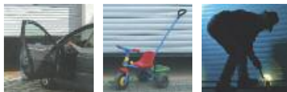
Komfort, Design, Sicherheit: Garagentore von LAKAL.

Denn LAKAL ist Ihr kompetenter Partner, wenn es um die richtige Wahl Ihres Garagentores geht. Ob im privaten oder gewerblichen Bereich, bei Neubau oder Renovierung.